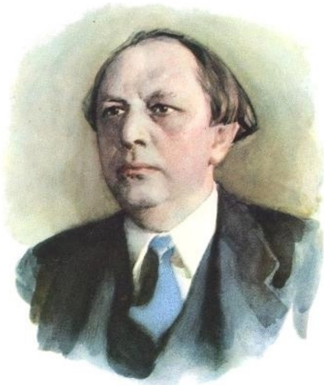
Алексей Николаевич Т О Л С Т О Й